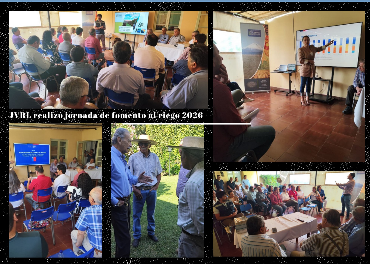
JVRL realizó jornada de fomento al riego 2026

La actividad permitió informar a las comunidades de aguas y agricultores de la cuenca sobre las principales líneas de financiamiento disponibles, los requisitos de postulación y los plazos vigentes, contando con la participación de representantes de INDAP y la CNR.