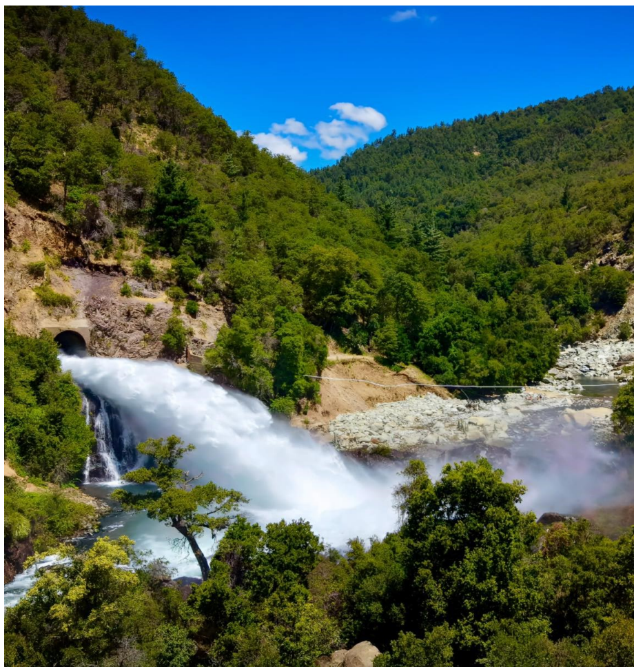
Flujo de agua que desembalsa el Bullileo hacia el río del mismo nombre.

5. Avanza la constitución del Canal Municipal.