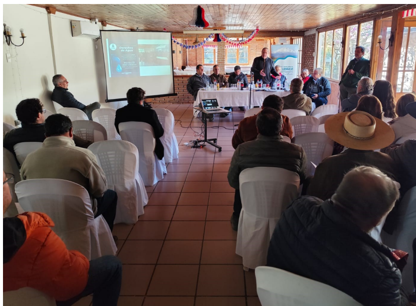
Asamblea sept. 2024.

La Junta de Vigilancia informa que la próxima Asamblea Ordinaria se realizará el miércoles 9 de septiembre , instancia en la que se presentará el balance de la temporada de distribución de aguas, estados financieros, actividades desarrolladas y se someterán a votación materias propias de la organización, entre ellas la cuota por acción de agua y la renovación de parte del Directorio.