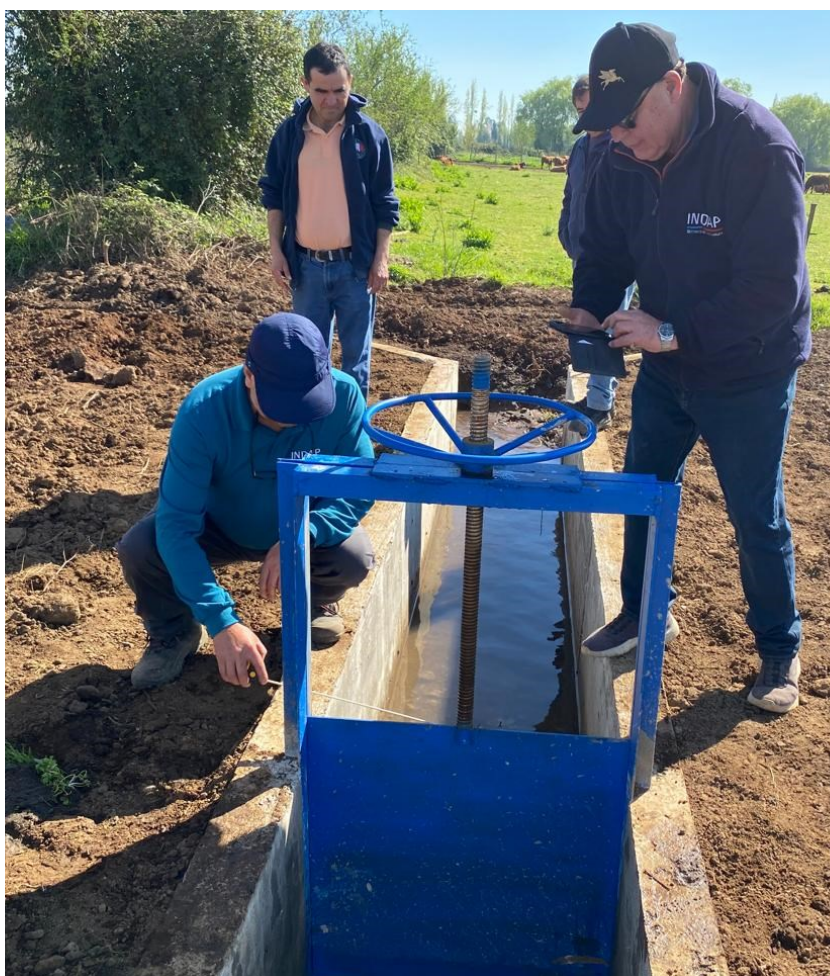
Trabajo en terreno de consultora Río Longaví.